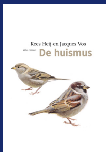
KEES HEIJ DE HUISMUS