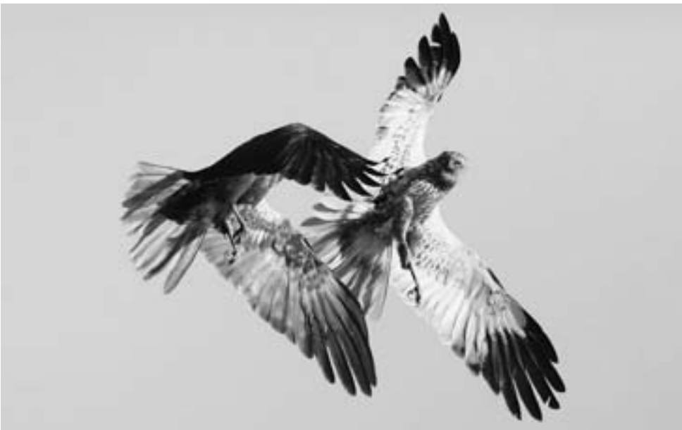
Speciaal ingerichte percelen moeten kiekendieven in Flevoland meer kansen bieden

beschut kunnen nestelen. Inmiddels lijkt de aantrekkingskracht van de akkers op deze vogels weer wat af te nemen, waarvan de oorzaak nog onderzocht wordt. Eén van de mogelijke verklaringen is dat er tussen de Oostvaardersplassen en de A6 ook een dergelijk kavel is aangelegd, zodat de vogels meer verspreid raken. Niettemin blijft de Dodaarsweg een must voor vogelaars en vogelfotografen die Flevoland aandoen, vooral in het winterhalfjaar.