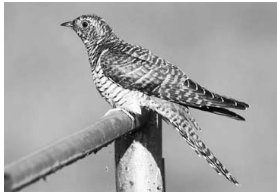
Koekoek, Waterland, 5 augustus 2013