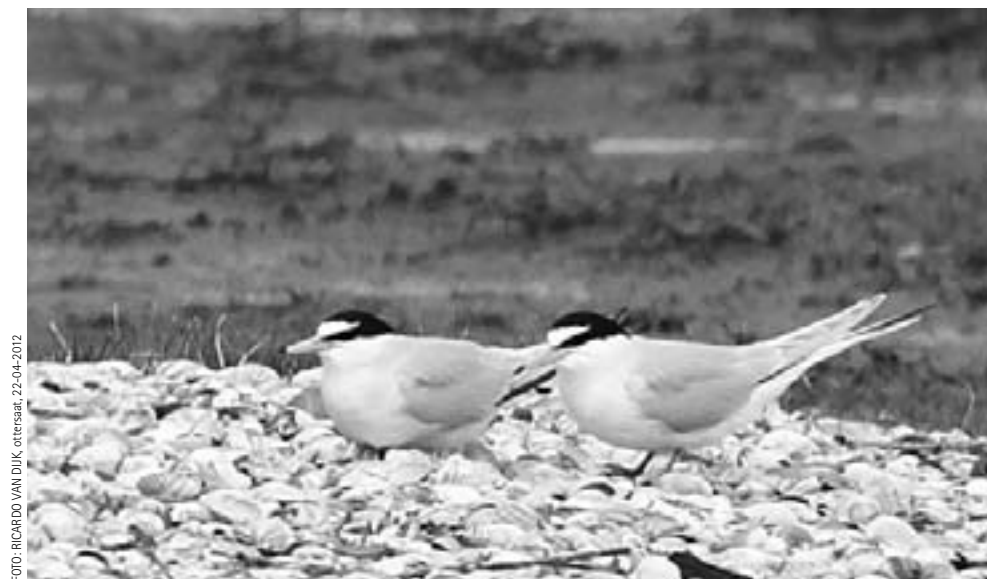
Texel is een goede plek om broedende Dwergsternen te zien

Amsterdammers die Dwergsternen in het broedgebied willen zien kunnen het beste terecht op de zuidpunt van Texel, de Hors. In 2012 broedden er op Texel ca. 70 paar Dwergsternen, wat een gemiddeld aantal is over de laatste tientallen jaren. De vogels zijn in de nazomer, behalve nog steeds op de Hors, ook te zien rond de Schorren (zoals bij het nieuwe natuurgebied Utopia) en in de Mokbaai.