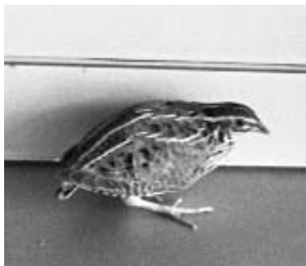
Kwartel, Schiphol, 2 augustus 2013

Temmincks Strandloper 14-7 Poppendammeerweeren 2 ex. (MH). 21-7, 11-9 IJdoorn 1 ex. (RvB, TV).