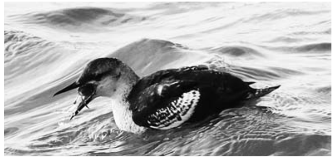
Zwarte Zeekoet is mogelijk langs de Brouwersdam

Op 7 november 2013 is het honderd jaar geleden dat de vermaarde Britse natuurontdekkingsreiziger en grondlegger van de evolutietheorie Alfred Russel Wallace overleed. Wallace dankt zijn faam voornamelijk aan zijn reis door voormalig Nederlandsch-Indië die van 1854 tot en met 1862 duurde en op grond waarvan hij zijn vermaarde boek The Malay Archipelago schreef. De Lijn van Wallace is een scheidslijn tussen het westen en midden van Indonesië met aan weerszijde een fundamenteel andere samenstelling van de zoogdier- en vogelwereld.