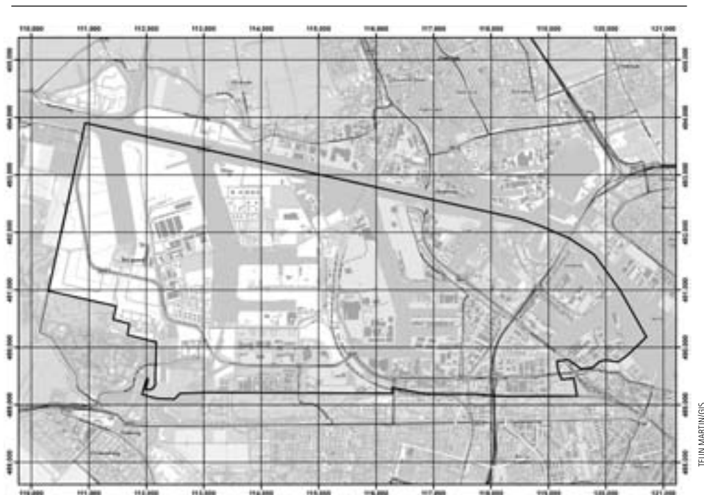
Kaart Westelijk Havengebied; het telgebied ligt binnen de zwarte lijn

A l een lange reeks van jaren inventariseren wij het Westelijk Havengebied op broedvogels. In het verleden koppelden we onze inventarisaties aan die van J. Walters, (1926-2009). Na 2000 was hij niet meer in staat om dit hem zo vertrouwde gebied te bezoeken, maar wilde van de ontwikkelingen toch graag op de hoogte blijven. We praatten hem daarom jaarlijks bij over het wel en wee van de vogelstand in het Westelijk Havengebied. In dit artikel bundelen we de jaaroverzichten van bovenstaande periode. Het gebied bestrijkt het 'beheergebied van Haven Amsterdam'.