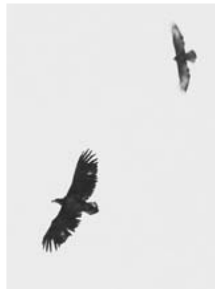
Zeearend, Vijfhoek, 27 september 2013