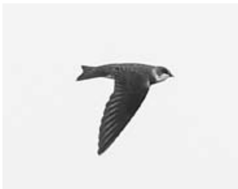
diemerpark, 14-04-2013