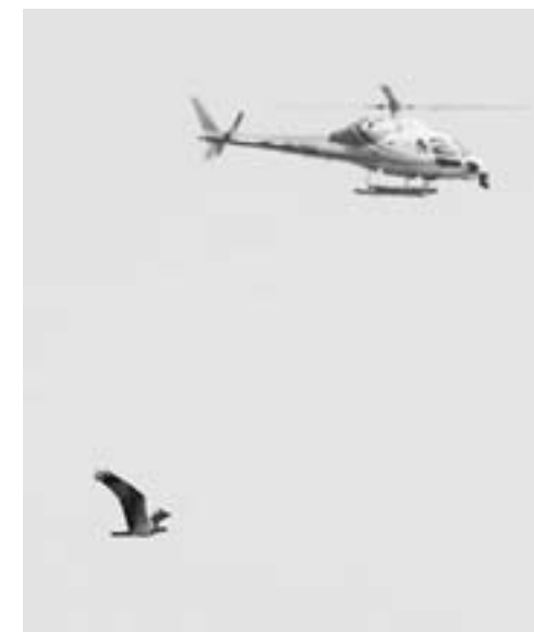
Visarend, Diemerpark, 29 augustus 2013