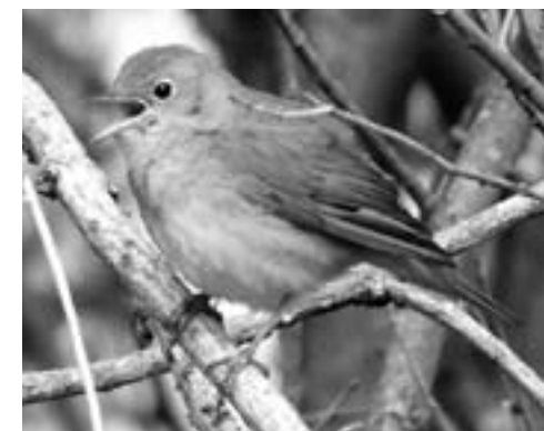
vijfhoek, 26-04-2013