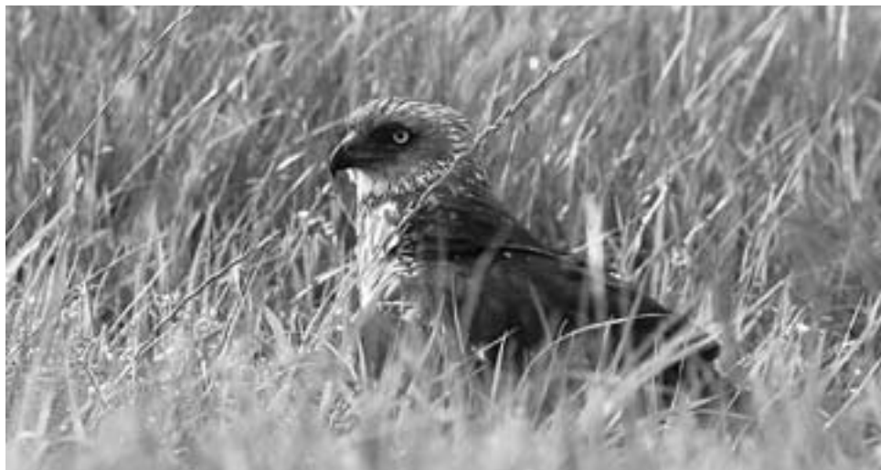
de belmermeer, 24-08-2013

Het IJperveld is belangrijk voor de Bruine Kiekendief