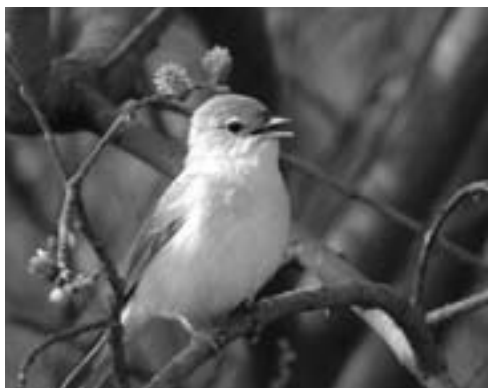
vijfhoek, 24-04-2013

Een bijzondere plek is Ruigoord, een voormalig dorp in de IJpolder, dat door een kraakactie van kunstenaars uiteindelijk niet gesloopt werd. De voormalige woningen en het kerkje worden nu gebruikt als ateliers en expositieruimte. Het eertijds hooggelegen dorp ligt nu, als gevolg van de zandopspuitingen rondom, als het ware in een kuil.