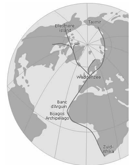
De Oost-Atlantische trekroute, met de Waddenzee, de Banc d'Arguin en de Bijagos Archipelago als belangrijke pleisterplaatsen