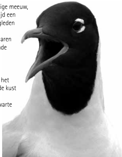
Knooppunt Holendrecht, 2 april 2004

De belangrijkste broedkolonies van de Zwartkopmeeuw liggen verspreid in heel Europa, zowel aan de kust als in het binnenland. Overwinteren doet de meeuw vooral langs de kust en dan met name in het Middellandse Zeegebied. Oorspronkelijk komt de vogel uit de omgeving van de Zwarte Zee, broedend aan de noordwestkust ervan. Het eerst - bekende - broedgeval buiten deze regio was in Hongarije, in 1940. Vanaf de jaren '50 van de vorige eeuw breidde de soort zich in Europa gestaag uit: Turkije, Griekenland, Bulgarije, Polen, Denemarken, Duitsland, België, Frankrijk, Italië en Groot-Brittannië. Na het eerste broedgeval - gemengd met Kokmeeuw - in 1959 op Schouwen-Duiveland, is het sinds 1970 een jaarlijkse broedvogel in Nederland. Vooral in de Delta is de soort succesvol, met 92 broedparen in 1990, 112 in 1991 en maar liefst ruim 1100 paren in 2001. Maar ook het aantal broedgevallen in andere delen van Nederland neemt toe, met name in het westen en rondom het IJsselmeergebied. Na de broedtijd verspreiden onze meeuwen zich over de kust van Groot-Brittannië en Ierland en van Frankrijk tot Spanje en Portugal.