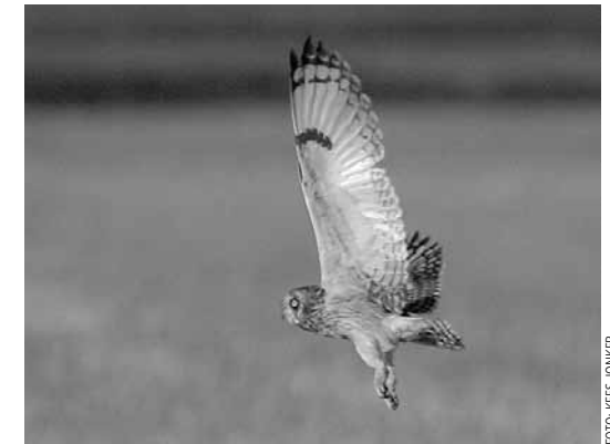
Velduil, Schiphol, 8 januari 2007

Pontische Meeuw 3-2 Erasmusgracht 1 ex. 2kj (RA). 11-2 Geuzenveld 1 m. ad. winter,