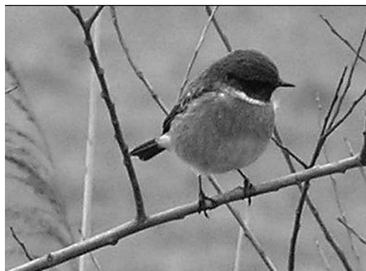
Roodborsttapuit, Ouderkerkerplas, 2 februari 2007

Sneeuwgorst 16-2 IJburg 5 ex. t.p. (FvdL).