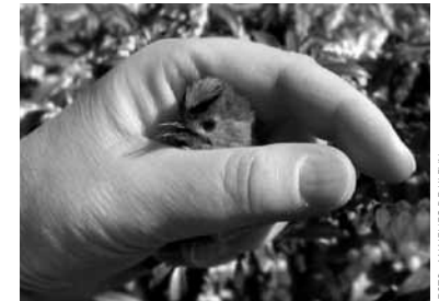
Goudhaantje, overleefde aanval door een Huiskat, Kerkstraat, 26 maart 2007

Het gebied De Grevelingen was oorspronkelijk een van de zeearmen die het water van de Rijn en